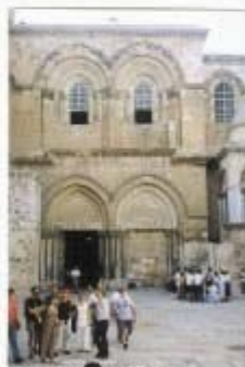
Chrám Božieho hrobu

Chrám Božieho hrobu, ktorý leží na Golgote, dal postaviť cisár Konštantín v rokoch 326 až 335, na popud svojej matky Heleny. Helena bola zvláštna žena, bola ako magnet na relikvie. Objavila kríž, na ktorom Ježiša ukrižovali, trňovú korunu a zopár ďalších svätých zaujímavostí. V chráme sa nachádza množstvo sošiek, sú v ňom rôzne mozaiky. Medzi najzaujímavejšie pamiatky v ňom, patrí hrobná kaplnka, kde leží kameň, ktorý zakrýval Ježišov hrob a taktiež sú to posledné tri zastávky Via Doloresa (Križová cesta). Toto je miesto, kde stál kríž a Boží hrob. Nad miestom kde stál kríž je diera, a ak človek vloží ruku do diery, môže sa dotknúť miesta, ktorého sa niekedy dotýkal Ježišov kríž. Keď budete vychádzať Križovou cestou (Via Doloresa) von z hradieb, dotanete sa až do Getsemanských záhrad, ktoré sa rozprestierajú na úpäť Olivovej hory.