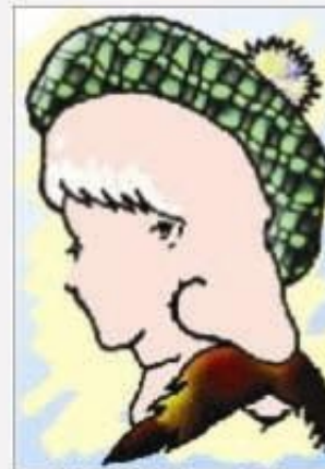
2. Koľko tvárí vidíte na obrázku?