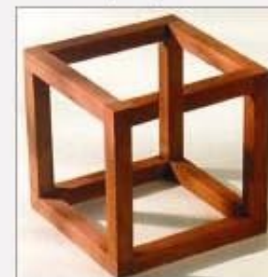
5. Dalo by sa toto postaviť - napr. z dreva?