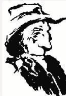
6. Aká tvára vidíte?