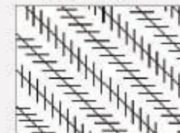
7. Sú dlhé čiary rovnobežné?