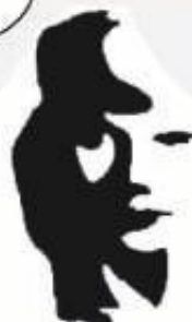
1. Čo vidíte na obrázku?